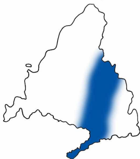
Principal área de distribución invernal del aguilucho lagunero.

Los mayores dormideros se localizan principalmente cerca de carrizales y humedales del sur y sureste de la comunidad: carrizal de las Madres (Aranjuez), lagunas y graveras de El Porcal (Rivas-Vaciamadrid), río Torote y laguna de San Juan. Las dos primeras localidades concentran buena parte de los efectivos invernantes. En el carrizal de las Madres se han llegado a contar hasta 81 ejemplares en el invierno 2002-03.