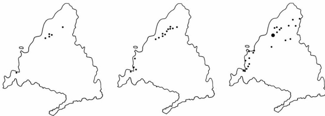
Distribución de las colonias de buitre leonado en 1979, 1989 y 2008.

La población madrileña de buitre leonado se ha incrementado de forma notable y constante desde los primeros datos, a finales de los años 70. En 1979 se encontraron siete nidos en dos colonias y tres décadas después los nidos están distribuidos en 20 colonias. Por tanto, el incremento se ha producido tanto en el número de colonias como en el de nidos. Del mismo modo ha aumentado la superficie ocupada, y hoy en día la población no está tan centrada en la zona de La Pedriza y el suroeste de la comunidad, como hace décadas. Fuera de esas grandes colonias, las más norteñas de Puebla de la Sierra, embalse del Villar y La Cabrera son las que incrementaron de forma más notoria su tamaño.