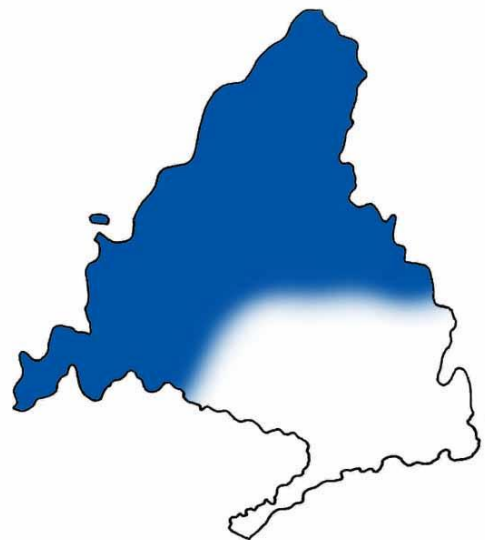
Distribución invernial del milano real durante los principios del presente siglo.

La población invernante madrileña se sitúa en torno a las 250-300 aves, formada por la población local que se ve reforzada por la llegada de aves procedentes de Centroeuropa. Aunque la población invernante se ha mantenido constante desde principios de los años 90, se ha producido una redistribución de sus efectivos entre tres núcleos principales de invernada.