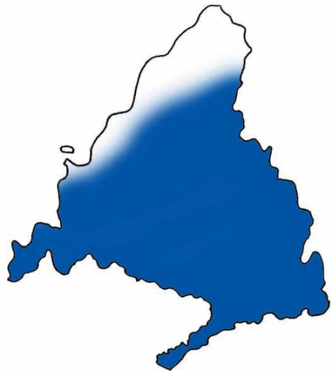
Distribución invernal de la avefría.

En invierno ocupa con preferencia los eriales, mientras que los cultivos de regadío o en mosaico con secanos presentan abundancias menores, pero también considerables.